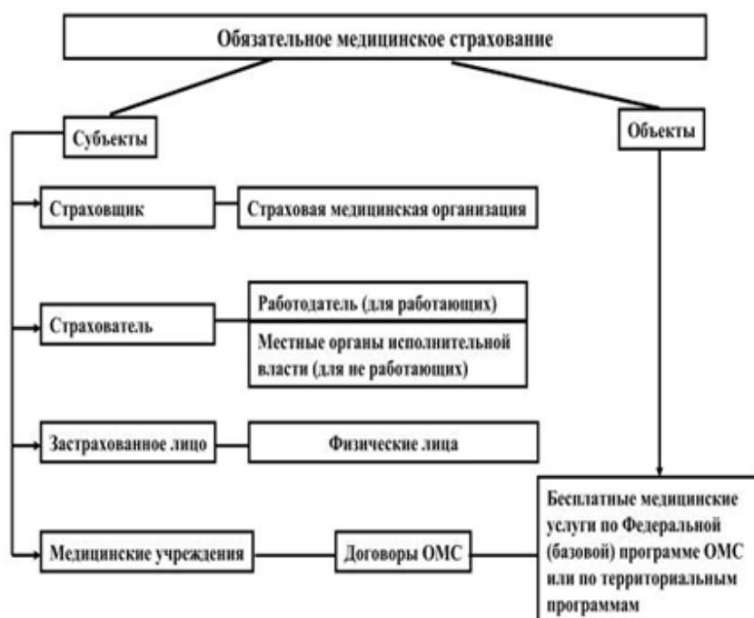
Рисунок 1 -- Субъекты ОМС.¶